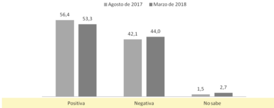
IMAGEN DE LA GOBERNADORA VIDAL

La Gobernadora María Eugenia Vidal conserva un nivel de aprobación elevado en la Ciudad, que asciende al 61%, contra un 36,4% de rechazo (+24,6 puntos de diferencial positivo).