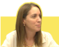
IMAGEN M. E. VIDAL

Excluyendo los regulares, la imagen “buena + muy buena” asciende al 45,6%, contra una imagen “mala + muy mala” que concita el 24,2% de las respuestas.